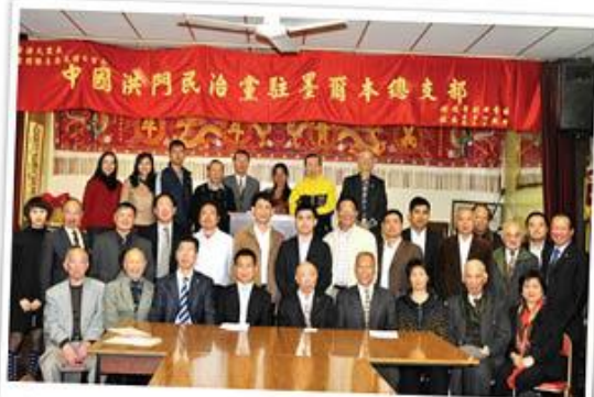
2010年10月欢迎湛江企业两会访澳，在澳门缔结友好社团