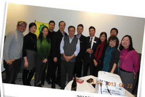
2013年广东总商会房产投资讲座