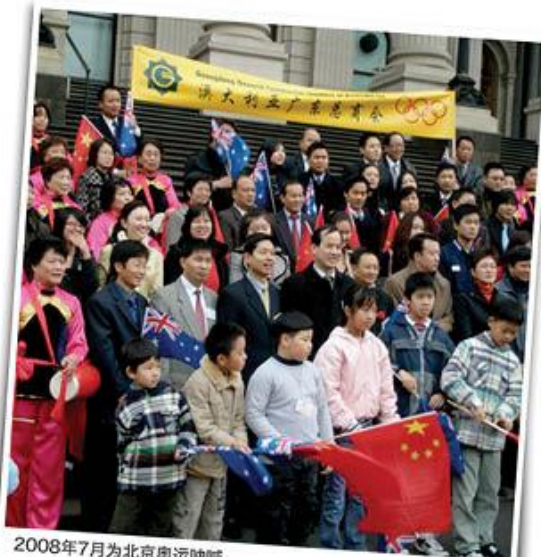
2008年7月为北京奥运呐喊