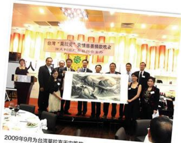
2009年9月为台湾莫拉克天灾筹款