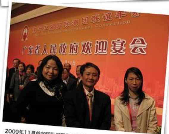
2009年11月参加国际潮团联谊年会