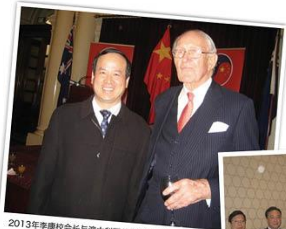
2013年李康校会长与澳大利亚前总理弗雷泽