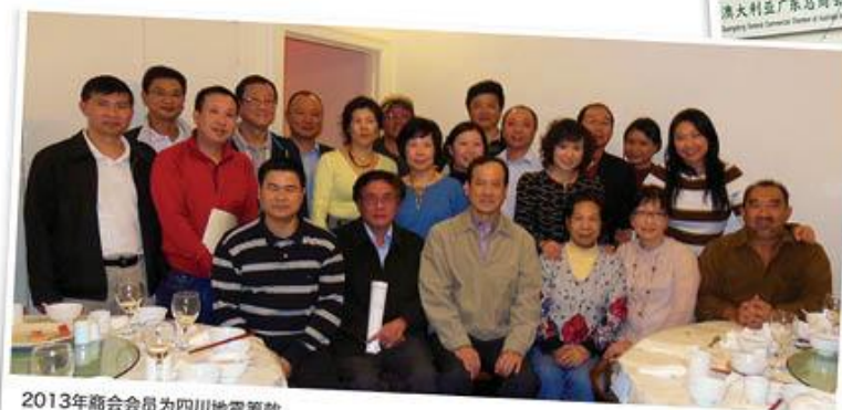
2013年商会会员为四川地震筹款