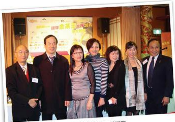
2012年参加香港发展局及澳洲讯报举办的金茶王总决赛