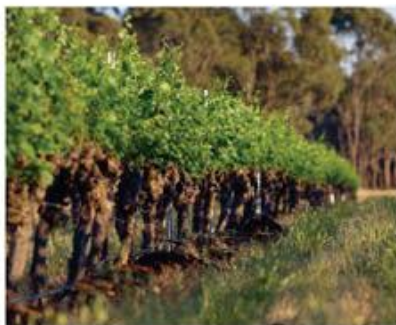
Bendigo Estate Vineyards planted in 1969