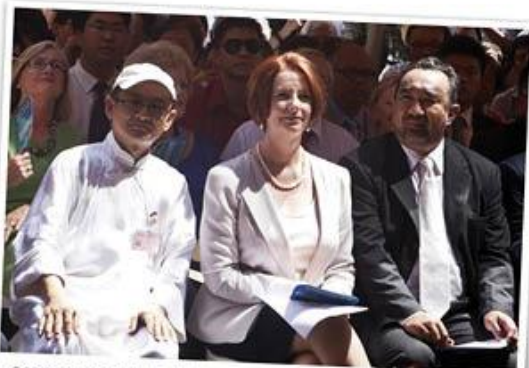
2012年1月与澳洲政要共庆春节