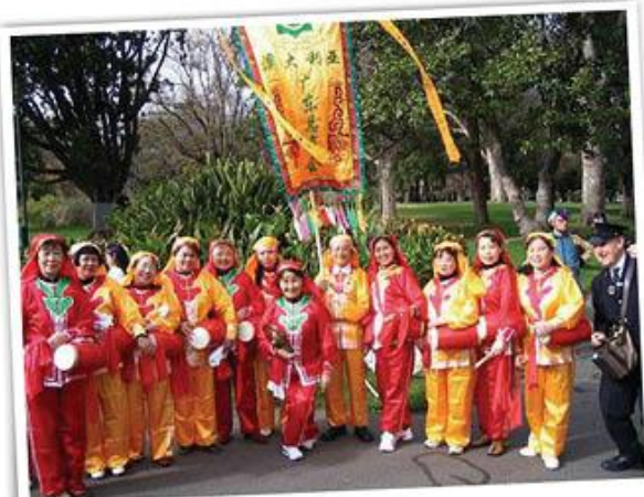
2009年7月Walk for Harmony英歌舞队首次亮相