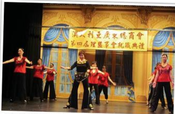
2012年2月第四届理监事会就职典礼文艺演出