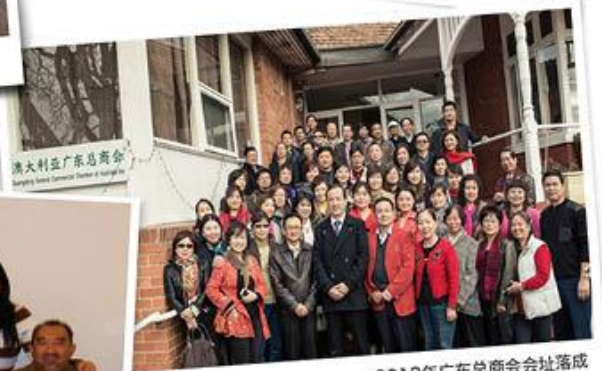
2013年广东总商会会址落成