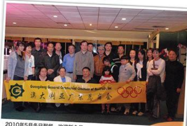
2010年5月冬日聚餐，欢迎新会员