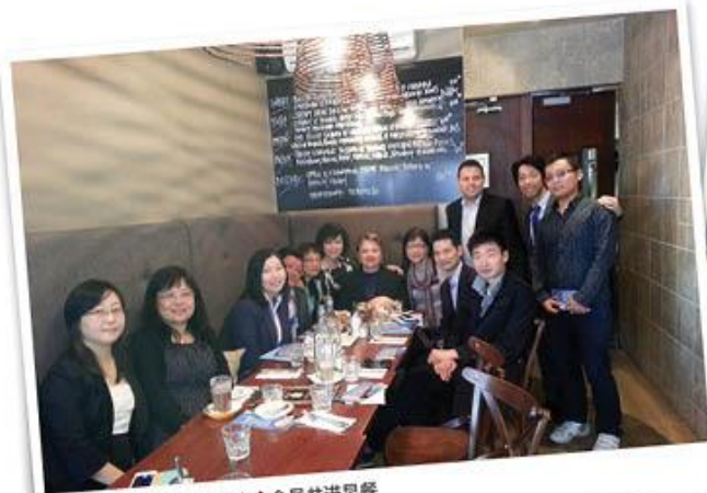
2013年工商业部长与商会会员共进早餐