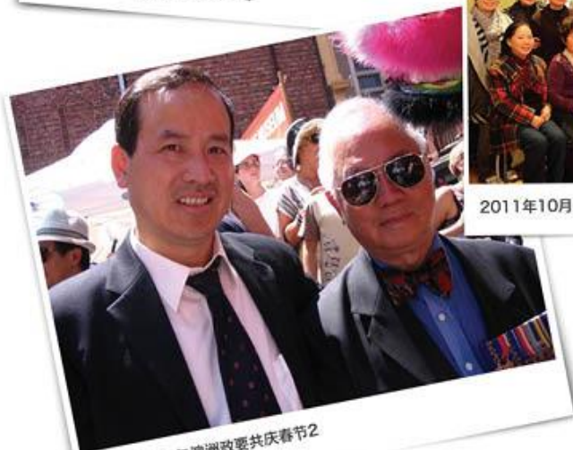
2012年1月与澳洲政要共庆春节2