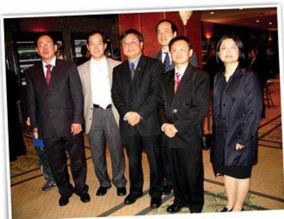
2005年参加总领馆招待会，早期会员与州议员合影