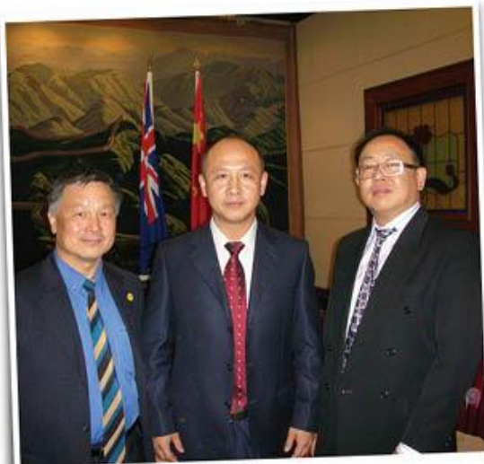
2010年12月欢迎黄凤文副总领事