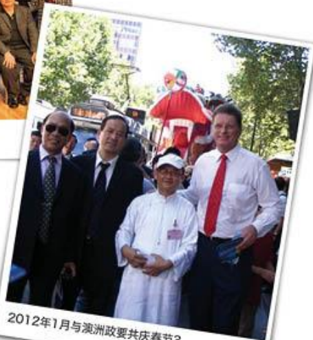
2012年1月与澳洲政要共庆春节3