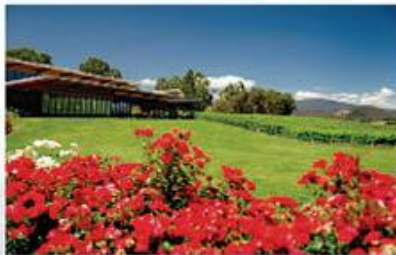
Yarra Valley Vineyard Resort & Spa