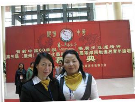
2009年11月参加两岸四地侨界青年论坛