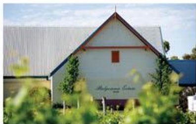
Bendigo Winery & Cellar Door