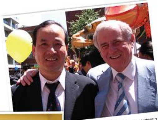
2012年1月与澳洲政要共庆春节1