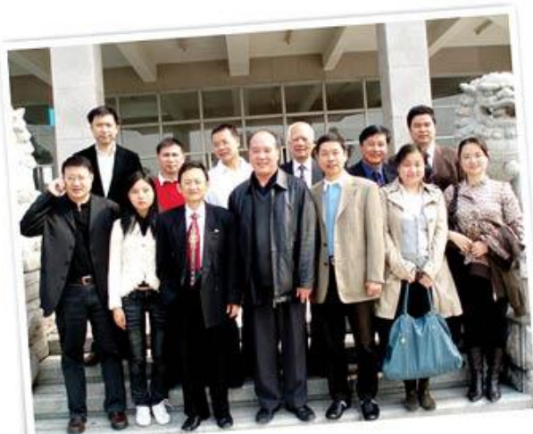
2008年1月拜访广东省侨联