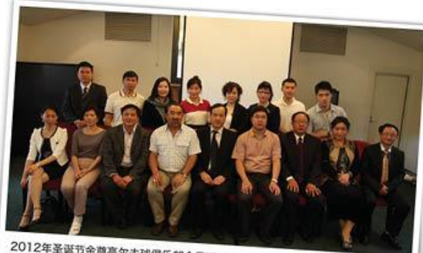
2012年圣诞节金尊高尔夫球俱乐部会员活动