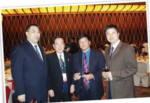
崔世安与广东商会理事的合影