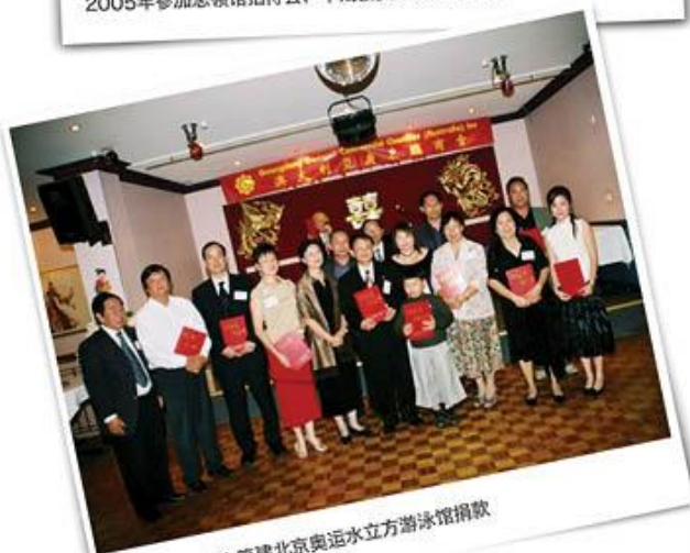
2007年4月为筹建北京奥运水立方游泳馆捐款